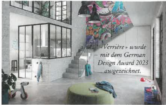
«Verrière» wurde mit dem German Design Award 2023 ausgezeichnet.