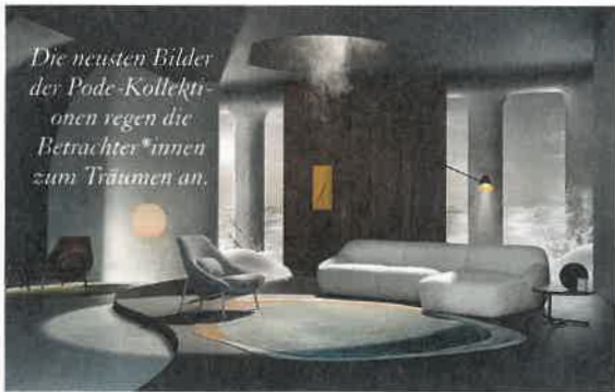
Die neuesten Bilder der Pöde-Kollektionen regen die Betrachter*innen zum Träumen an.

Raumgliederungssysteme können Wunder wirken, vor allem wenn sie so attraktiv wie «Verrière» sind. Das System besteht aus variabel einsetzbaren Trennwandelementen, deren Kombination aus filigranen Aluminiumprofilen und Glasfüllungen transparente Möglichkeiten schafft, Räume zu strukturieren. «Verrière» wird individuell für den jeweiligen Einsatzort gefertigt. Die wahlweise in Silber eloxiert oder Schwarz pulverbeschichtet erhältlichen Aluminiumrahmen lassen sich mit verschiedenen 12 mm breiten Sprossenversionen zusätzlich gliedern und gestalten. Alternativ oder ergänzend können vertikal oder horizontal aufgesetzte Varianten verwendet werden. Die sich daraus ergebende gestalterische Bandbreite reicht vom Architect Style mit grosszügigen Glasflächen bis zum Industrial Look mit kleinformatiger Sprossengliederung. www.raumplus.com