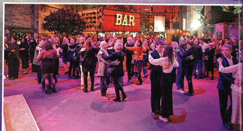
... die sich im Anschluss selbst nicht lang bitten ließen, die Tanzfläche zu stürmen.