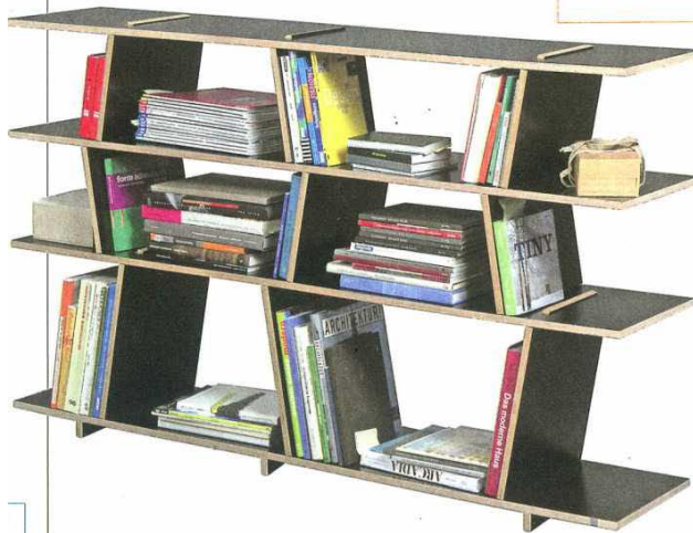
MOORMANN, Else. Seiten und Böden – nothing Else. Dieses Regal braucht keine Schrauben, keine Streben oder Verspannungen. Die horizontalen Böden nehmen in ihren Querschlitten die Seiten auf. Allein deren Schrägstellung sorgt für Stabilität.