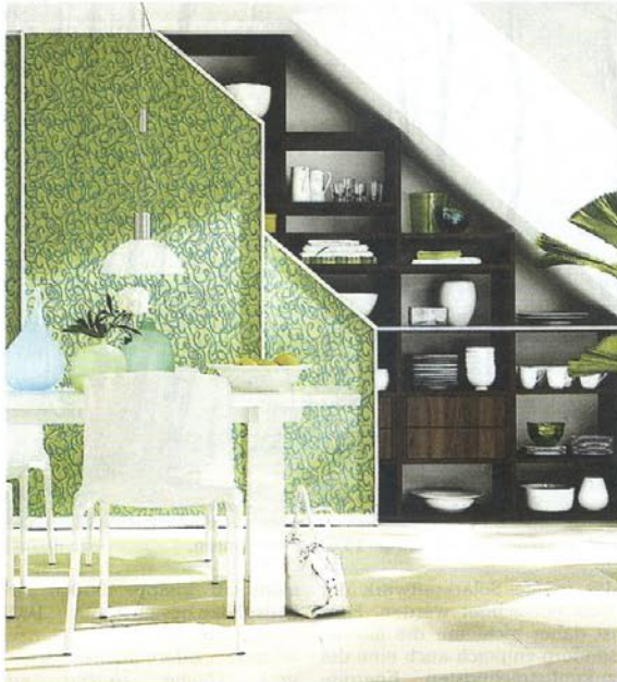
Passgenaue Regalsysteme sind ein schöner Hingucker – und sie schaffen in Räumen mit Dachschrägen mehr Stauraum.

Spezielle Regalsysteme sorgen für Stauraum / Niedrige Möbel bieten sich an