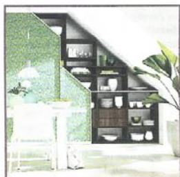
Schöner Wohnen unter dem Dach 19