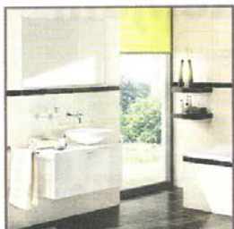
Barrierefrei im heimischen Bad 12

BREMER ANZEIGER SONNTAG, 13. MÄRZ 2011 WEST/NORD