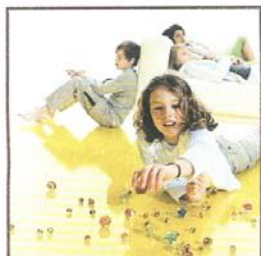
Wärme direkt aus dem Fußboden 14