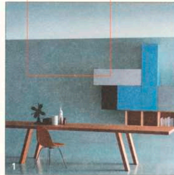
1 „ Minimo “, 2008, ein schlichter Tisch von Art Director Piero Lissoni 2 „ Ferro “, 1994, ein Tisch aus verschweißtem Falzblech