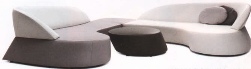
Eigenwillig: das Sofa „Morena“.

Modern, voluminös und wohnlich lädt „Pure Elements“ zum gemeinschaftlichen Verweilen ein. Entworfen von dem Designerteam Schnabel / Schneider bietet „Pure Elements“ durch die modular zusammenstellbaren Anbauelemente beinahe unendlich viele Gestaltungsmöglichkeiten. Drei Sitzelemente, drei Rückenlehnen und drei Armlehnen werden ergänzt durch ein 30°-Sitzelement, einen Couch- und einen Beistelltisch sowie ein 30°-Tischelement, welches zwischen den einzelnen Sitzelementen in die Gruppe integriert wird.