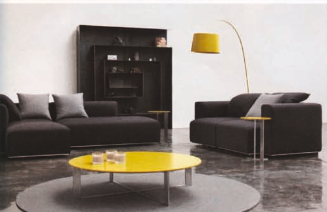
„Pure Elements“ – Eine Landschaft zum Leben. Interprofil

Ein weiteres Kernthema ist eine Neuentwicklung zusammen mit dem Designer Steven Schilte. Entstanden ist ein breit einsetzbares, modernes Sofaprogramm mit ausgefeilten Funktionen. MLiving wird sich erstmals zur imm im veränderten Corporate Design präsentieren und damit visuell in die Markenfamilie integriert. Das neue Gesicht des Sortiments zeigt sich in den modernen und zugleich anspruchsvollen Modellen an neuen Funktionssesseln.