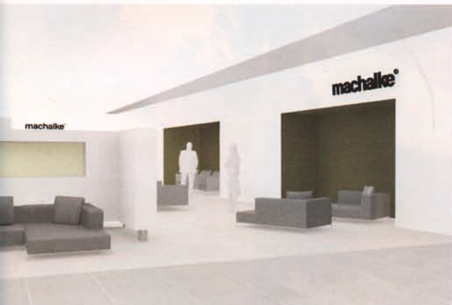
Der neue Messestand bildet durch klare Linien und innovatives Design den passenden Rahmen.