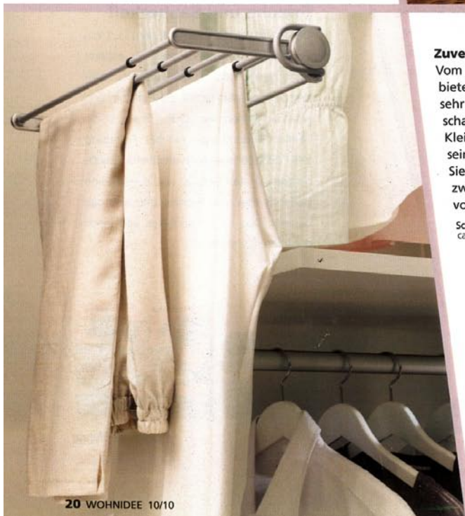
20 WOHNIDEE 10/10